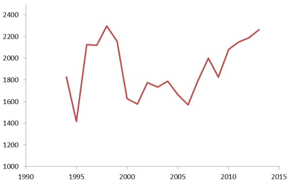
Uren hulp per jaar